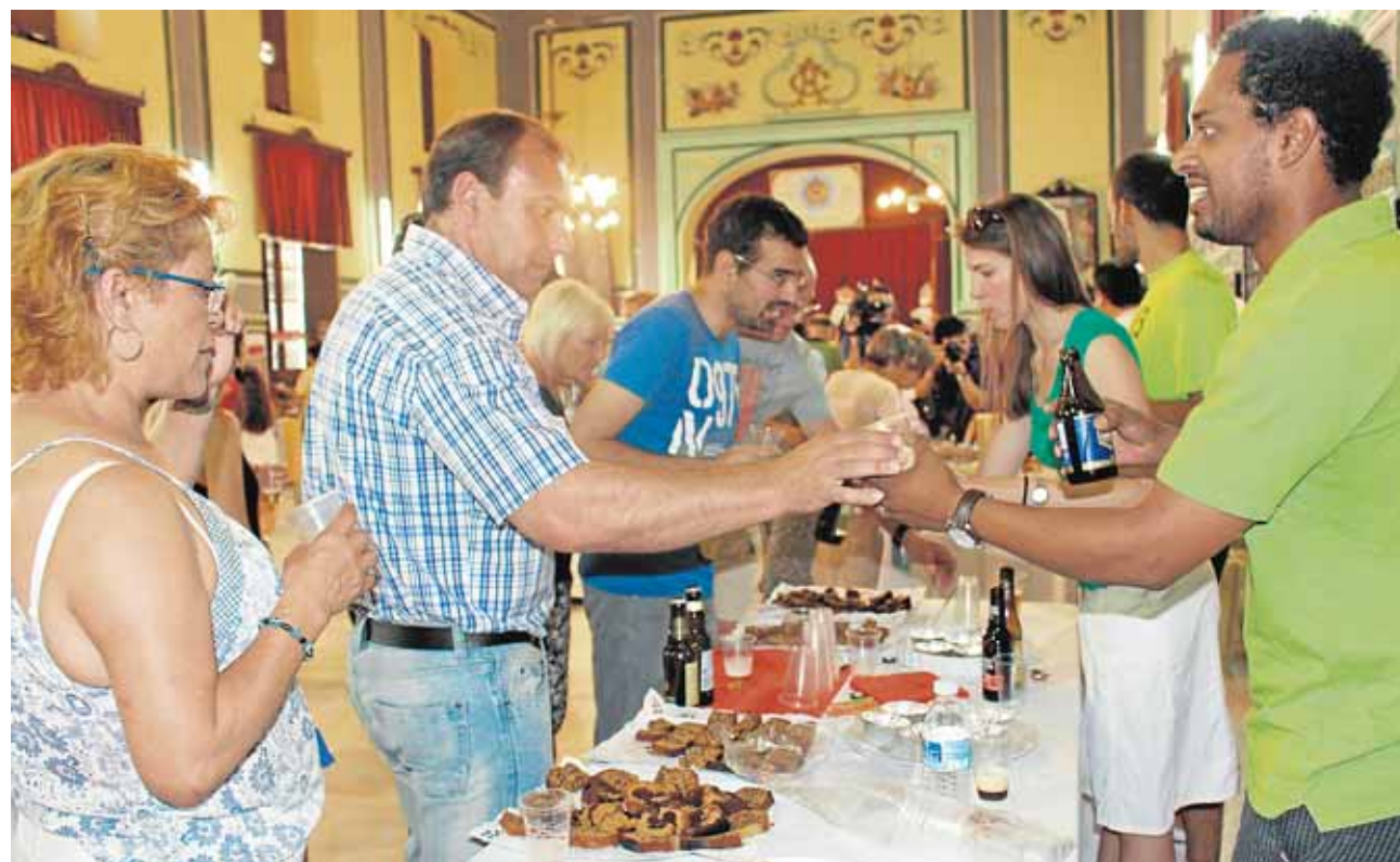
Imagen del encuentro intercultural gastronómico celebrado en el Casino de Artesanos de Écija

Muestra ferroviaria Para diciembre prepara una exposición de trenes, el Día de la Radio y un concierto de Navidad