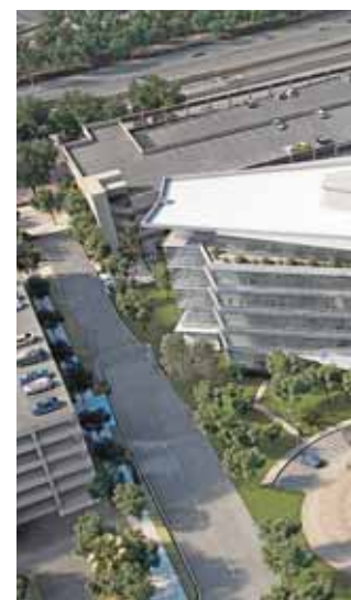
Diferentes infografías realizadas por la empresa palaciega. Imagen 1: Forbury Place (Londres, Inglaterra). Imagen 2: KPF (Guangzhou, China). Imagen 3: Form4