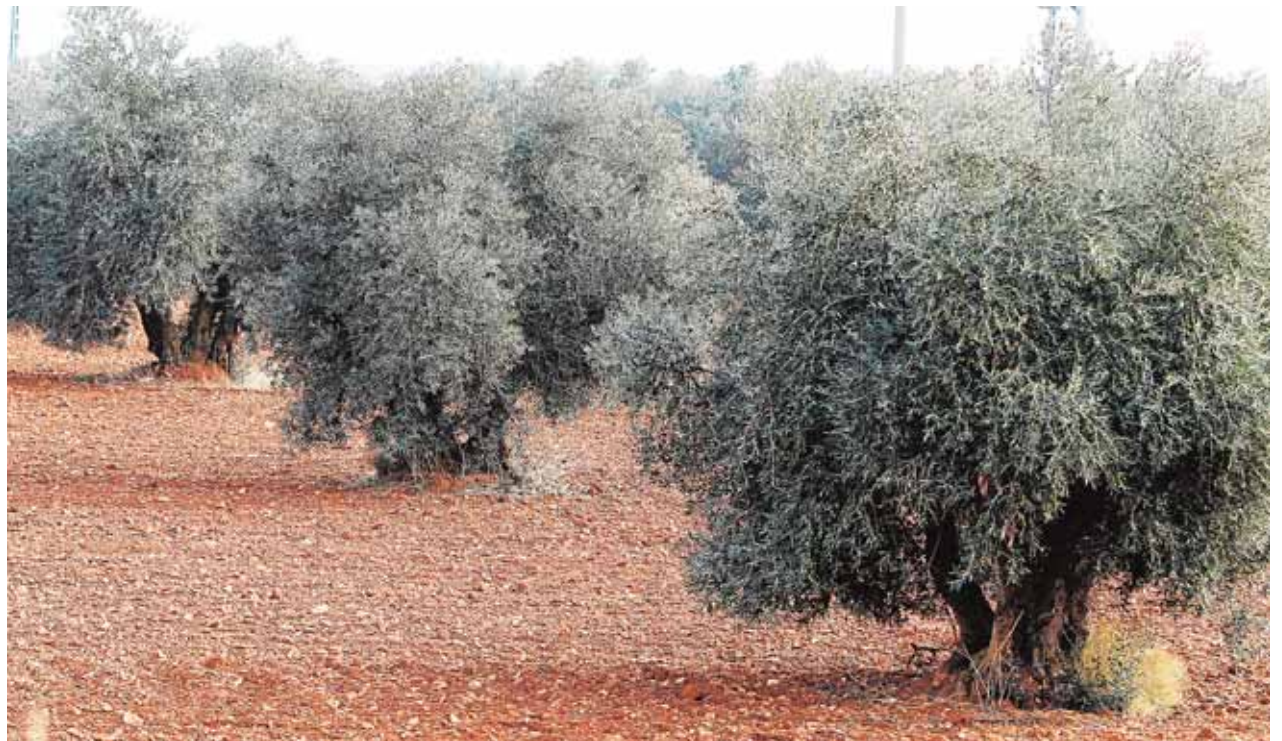
El cultivo del olivar es el predominante en la Sierra Sur sevillana.

Con un clima y un terreno de sierra, la localidad comenzó como un valor diferencial el cultivo de regadío con productos como el algodón, el maíz o la patata. El río también permitió otro tipo de mejoras para la localidad. «En una información de ABC del 28 de junio de 1964 se recoge como se hicieron mejoras en la presa Malpasillo», señala el historiador. Gracias a estos trabajos se mejoró la generación de electricidad y en el riego de cultivos. Además el pueblo contó durante años con unas minas de hierro en la zona de La Cabrera. En la actualidad, esas tierras, escondite de «El Tempranillo», tienen en su hermoso paisaje su principal impulso para el turismo.