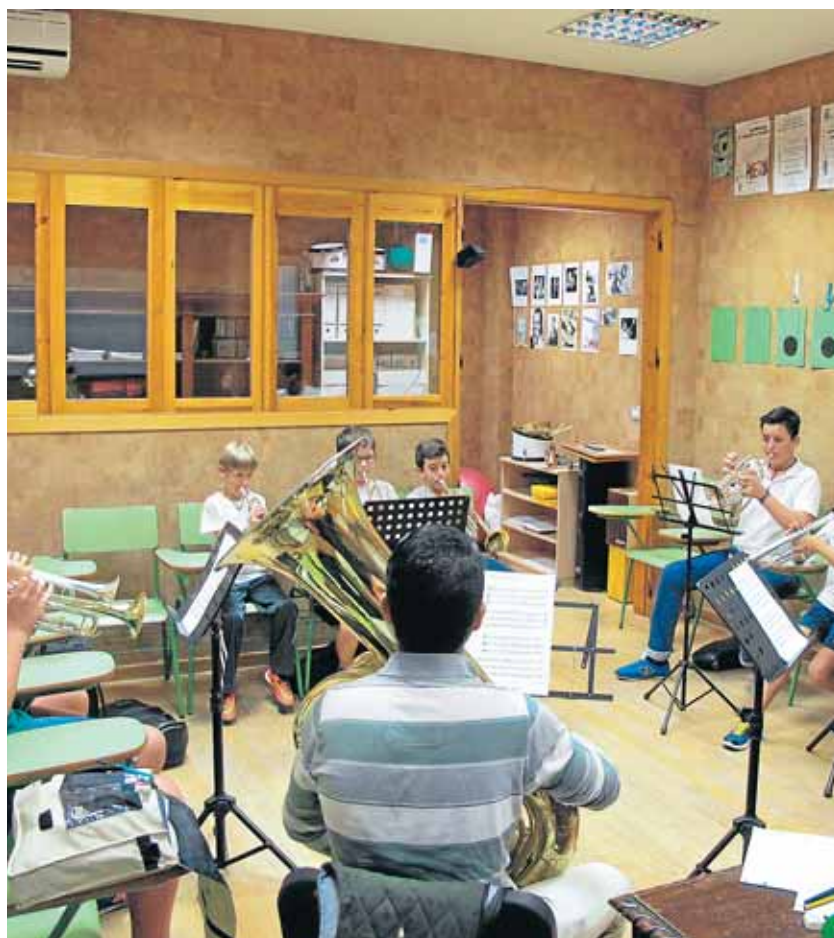
La escuela dispone de unas instalaciones acordes a la necesidades

Después de unos primeros años en los que primó la organización y los siguientes centrados en superar las carencias de materiales e instrumentos, en su 15 aniversario la escuela de música confirma una consolidación que se hace visible en las instalaciones de la Casa de la Cultura y en que, por ejemplo, «las clases están totalmente insonorizadas y todas disponen de un piano», subraya López.