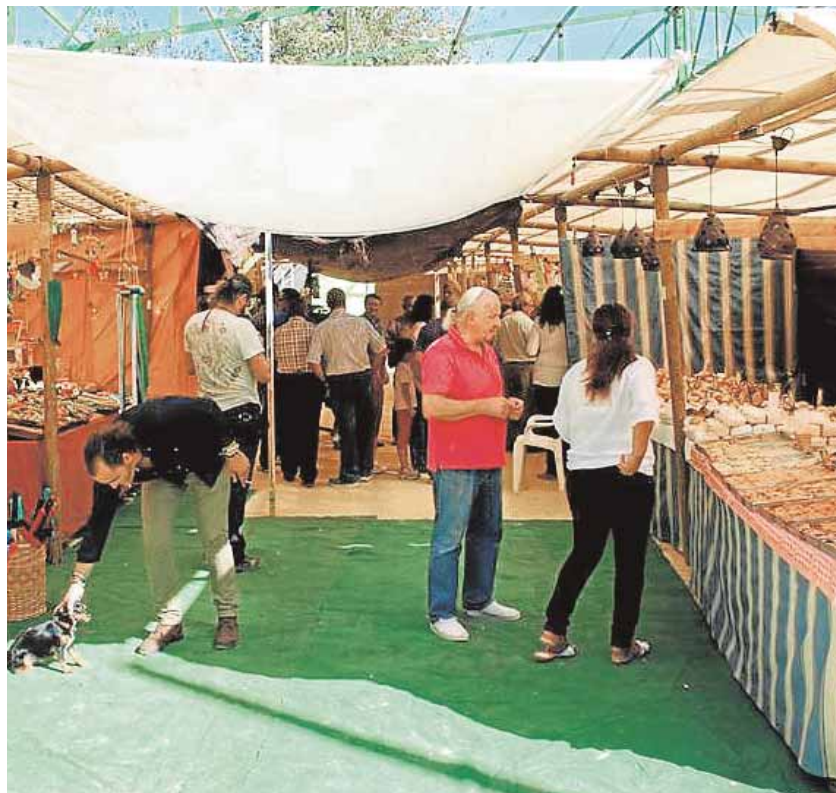
Este evento reúne a ganaderos de toda la provincia de Sevilla

Las actividades tendrán su fin el domingo por la noche, cuando se repartirán premios a los ganadores de las distintas exhibiciones y yincanas organizadas, un gran colofón para estas fiestas de Paradas.