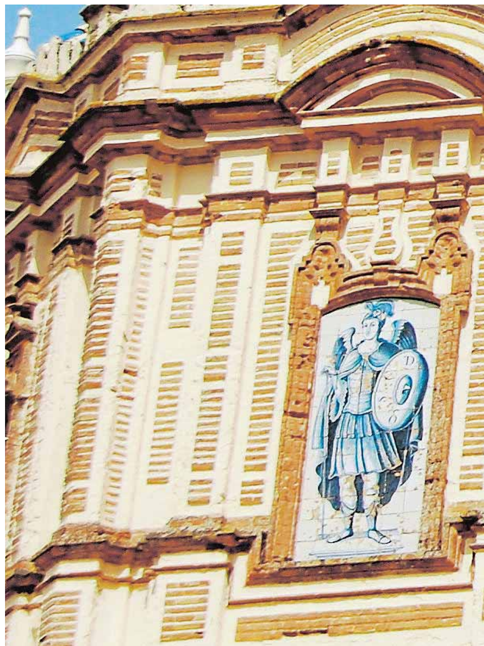
Una hermosa representación del arcángel San Miguel decora la iglesia de San Pedro

de la Contrarreforma, hace abundar estas representaciones. Es tiempo de auge de determinadas devociones, como la de los arcángeles, que en Carmona tiene interesantes representaciones entre las que Anglada cita las de la cúpula de la sacristía de San Pedro, un panel de San Rafael en el Hospital de San Pedro o una figura de San Miguel en la Hacienda Palma Gallarda. Auge también de la Inmaculada Concepción que se representa en el convento de Santa Clara, en el patio de Santa María o en San Blas. O el Santo Rosario, con un ejemplo destacado en la Hacienda de La Buzona. En