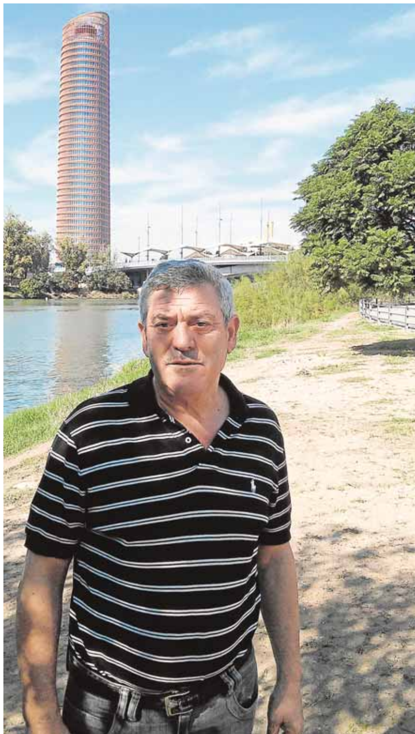
El historiador en una imagen tomada en Sevilla capital

La historia de Badolatosa y de su crecimiento económico está fuertemente vinculada al marquesado de Estepa, uno de los motivos que ha impulsado al autor a realizar este trabajo. «Realicé mi tesis doctoral sobre el marquesado de Estepa durante el siglo XVIII, después decidí continuar investigando sobre los pueblos que lo conformaron durante los siglos XIX y XX. Uno de ellos era Badolatosa», explica. Con este último volumen engrosa el número de localidades de la Sierra Sur que ha estudiado, ya que también ha escrito sobre Estepa, Aguadulce o sobre La Roda de Andalucía.