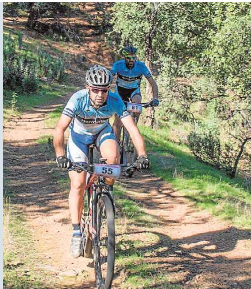
Participantes de la III Maratón BTT Riscos de la Viñuela

«El gran atractivo de esta carrera, es que seguramente sea una de las más duras de Andalucía», comenta el alcalde. «Además pretendemos que se